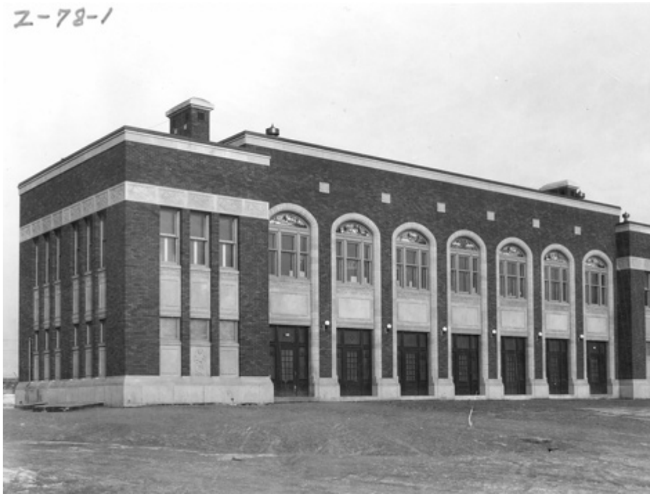
45. Photo du même endroit aujourd'hui (100 points)